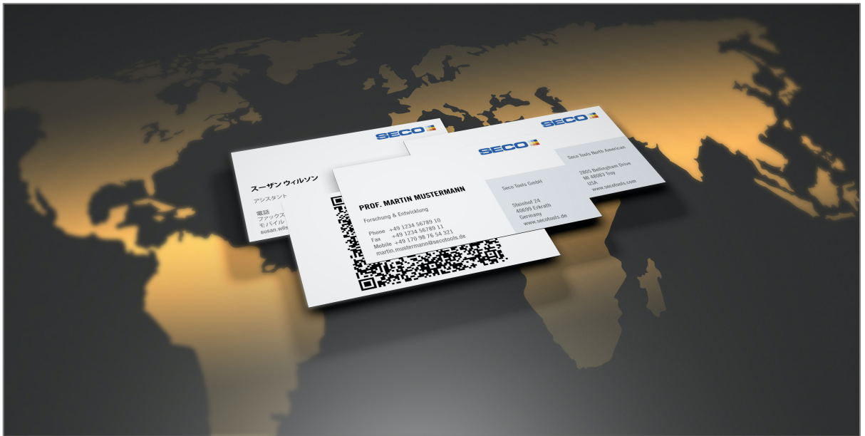
Weltweite Visitenkartenproduktion mit dem Visitenkarten Manager